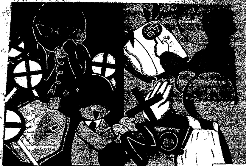
R5 地域安全運動入賞作品