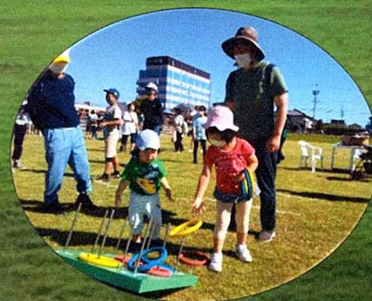
ミニゲームのイメージ