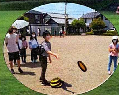
ミニゲームのイメージ